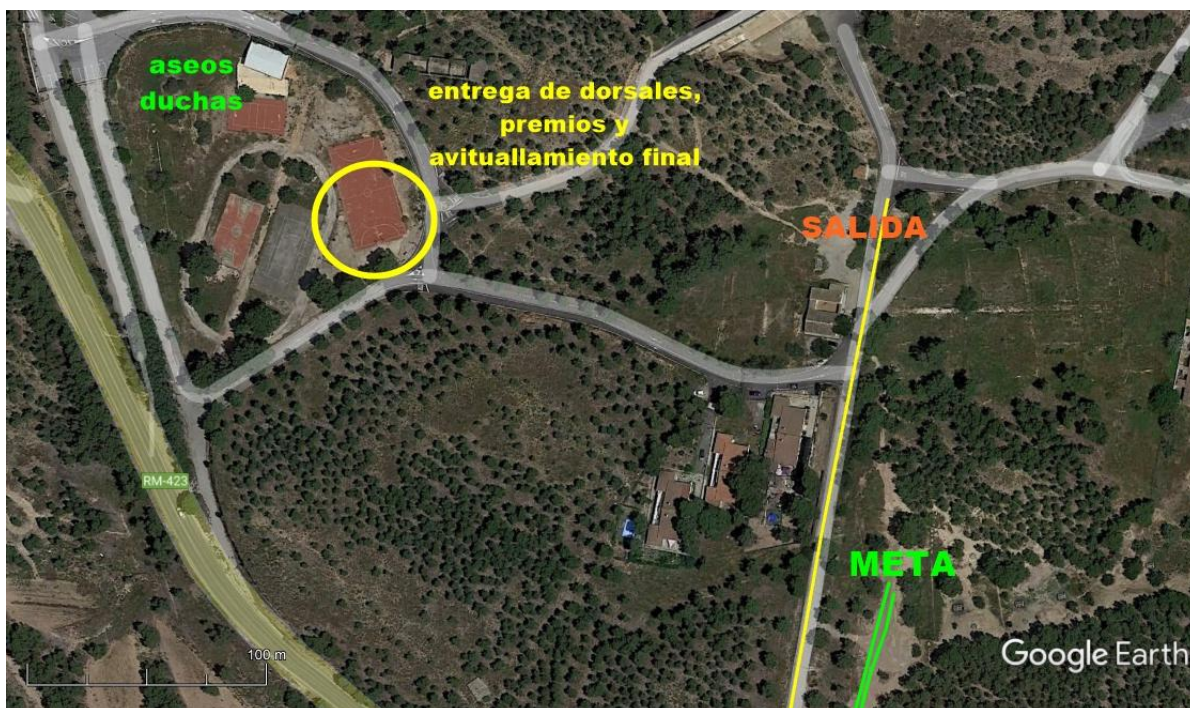
Imagen de la anterior ubicación que recogía en reglamento.

Imagen de la nueva ubicación de la zona de entrega de dorsales, trofeos y avituallamiento final.