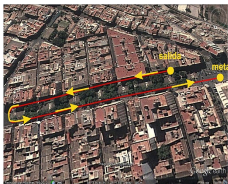
Carrera Chupetines, Pre-Benjamín y Benjamín